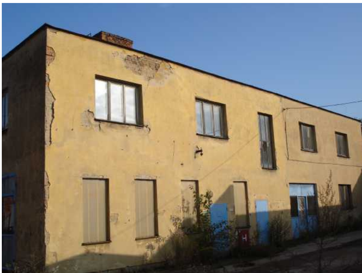
Objekt šaten a sociálních zařízení ( E )