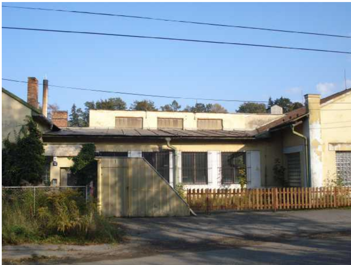
Pohled uliční na sklad materiálu ( B )