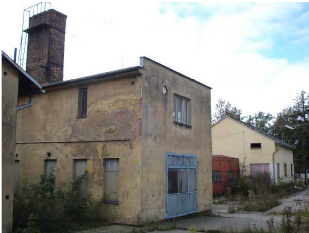
Šatny a soc. zař. ( E ) + administrativa ( A )