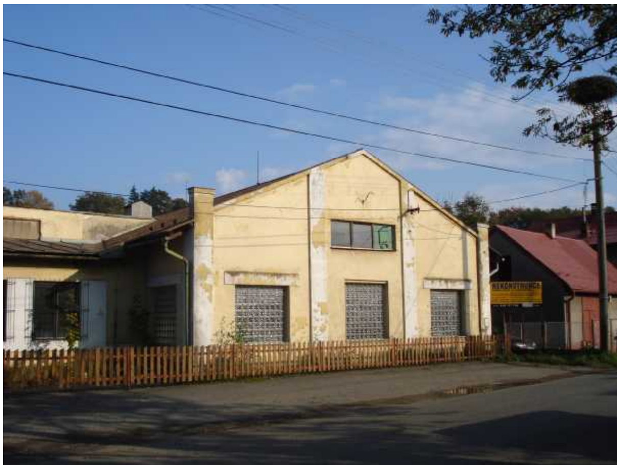
Pohled uliční na čelo výrobní haly ( C )