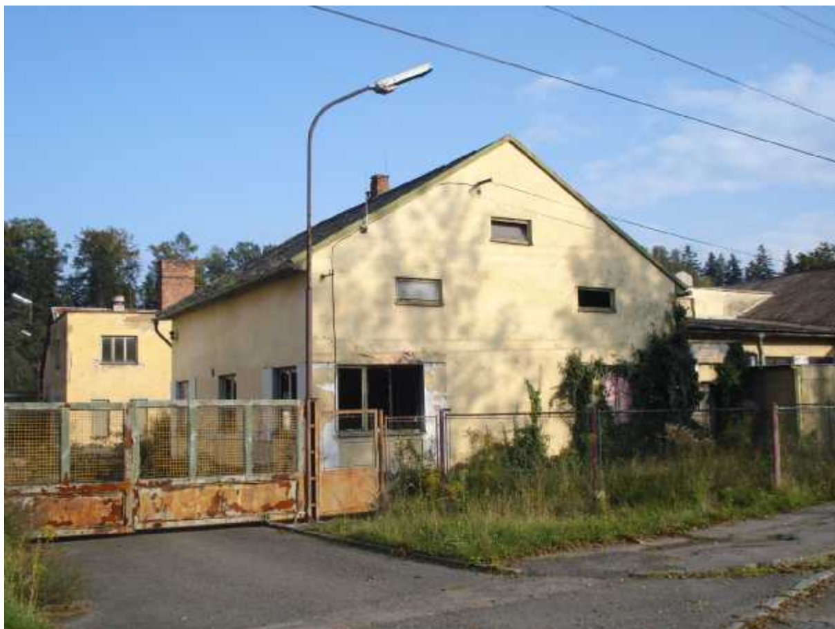
Pohled na hlavní vjezd– administrativní budova ( A )