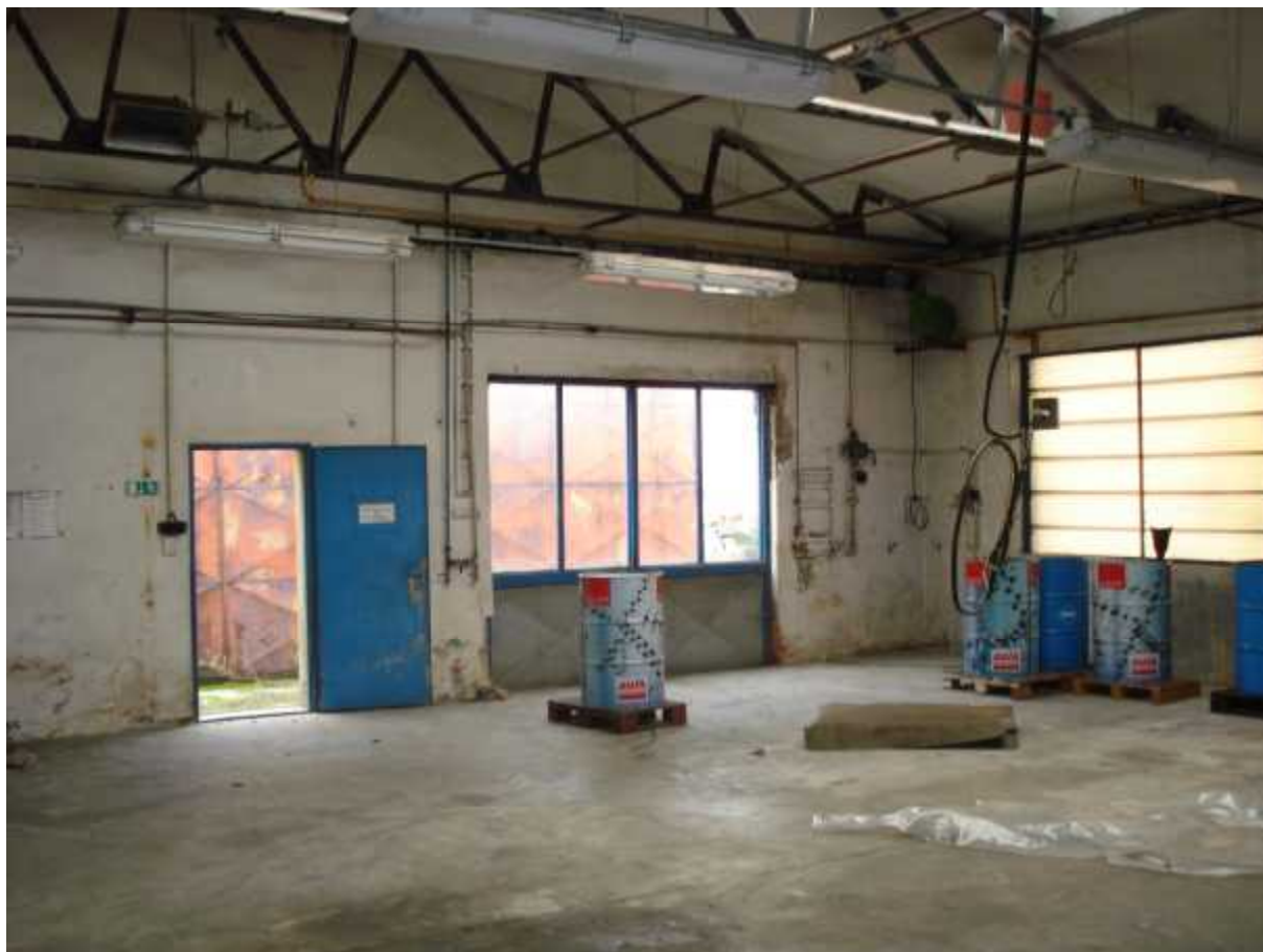
Sklad materiálu ( B )