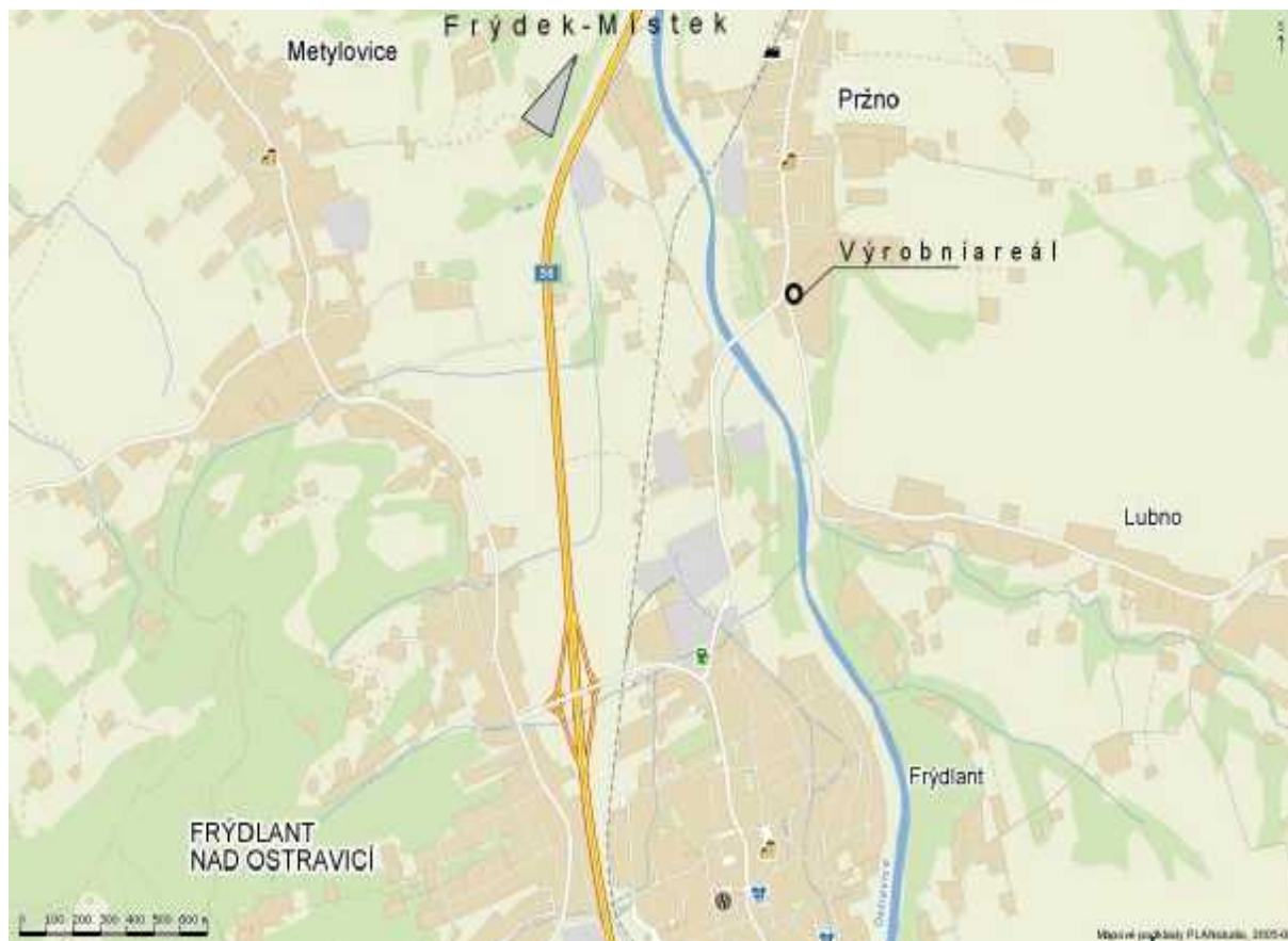
Poloha na mapě