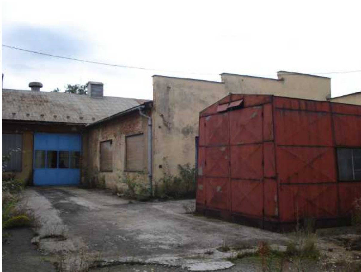
Vjezd do haly ( C ) , vpravo sklad materiálu ( B )