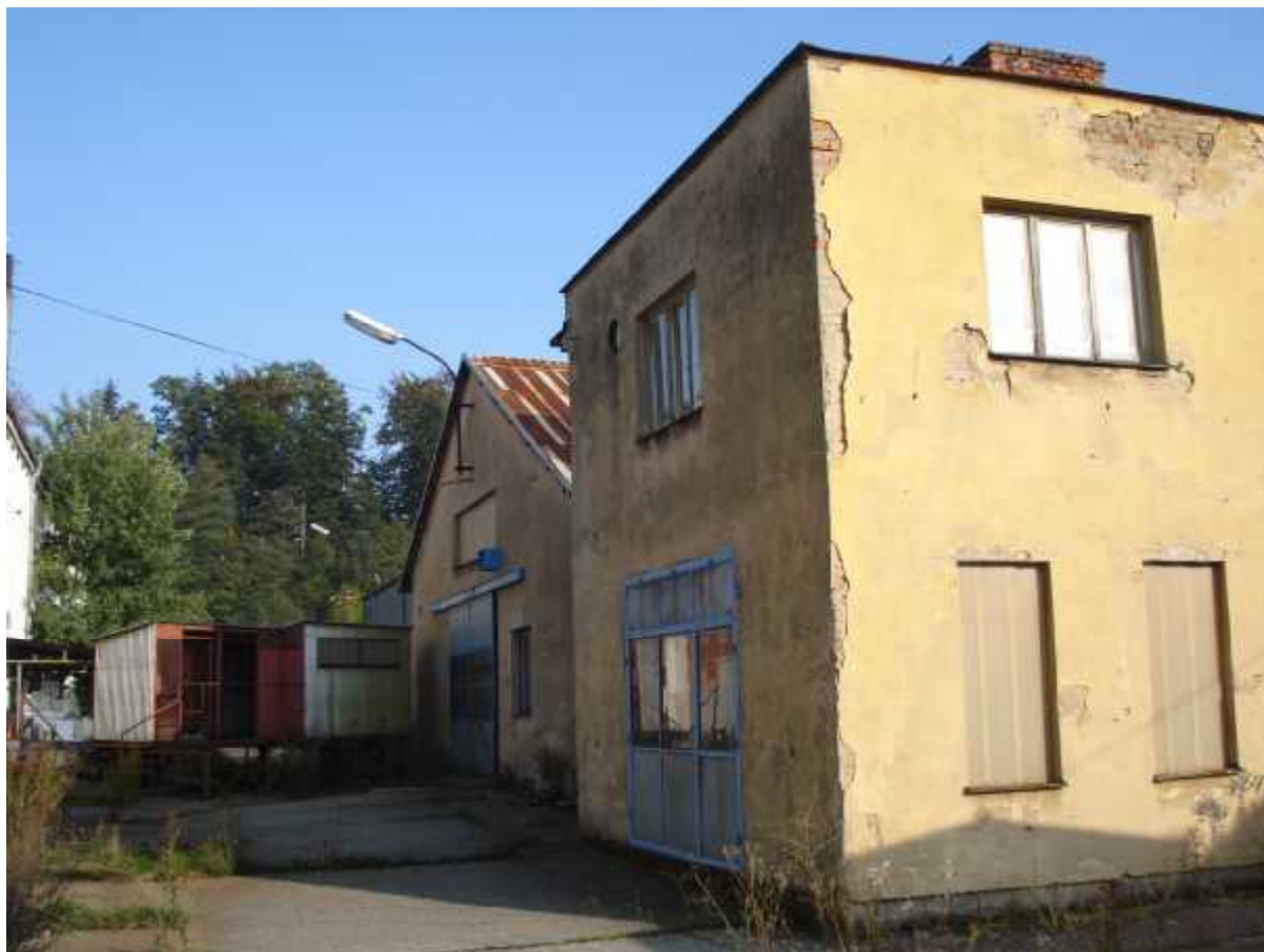
Objekt šaten a soc. zař. ( E ) a za ním výrobní hala ( D )