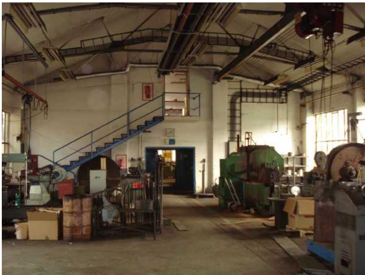
Hala ( C ) – vzadu spojovací krček do haly ( D )