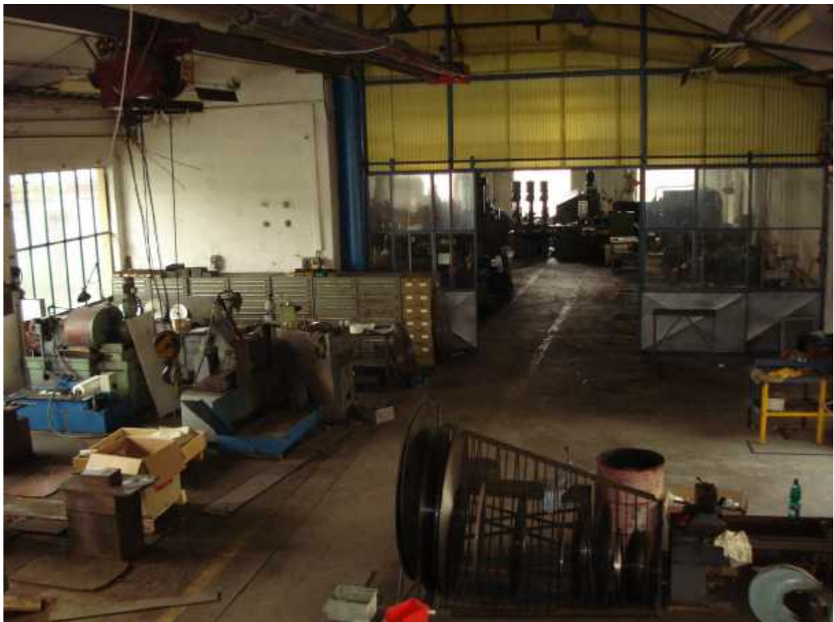
Hala ( C ) – 490 m 2