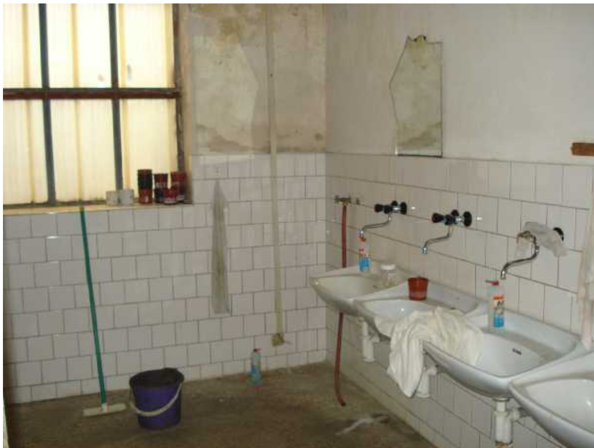
Umývárna v objektu ( E )