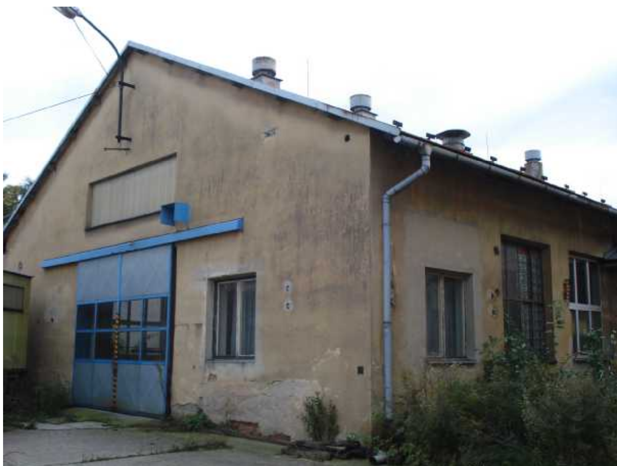
Výrobní hala ( D )