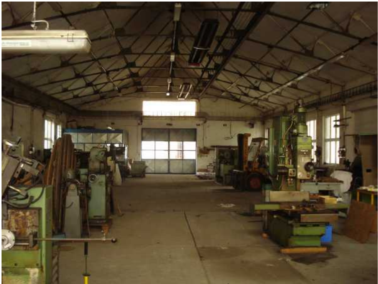
Hala ( D ) – 550 m 2